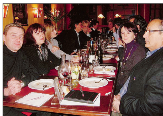
Au cours du repas d'intronisation

Côtes de Beaune, Saint-Véran, Montheil, des vins de Bordeaux, d'Alsace, des crémants de Bourgogne, des produits de terroir tels des escargots, foie gras, spécialités du Sud-ouest, salaisons, des fromages de chèvre, de Savoie, des Pyrénées, mûster, des confiseries, chocolats, pâtisseries, crêpes, des moutardes, épices sont à dé-